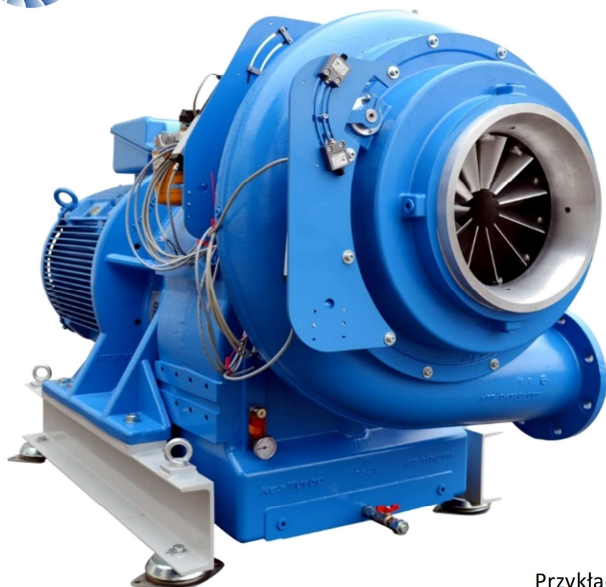
Przykład dmuchawy o zawieszaniu B5